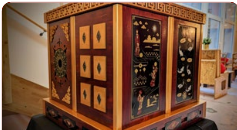
Le coffre des Nigm

DIRECTEMENT IMPLANTÉ DANS LE YOURI BAR !